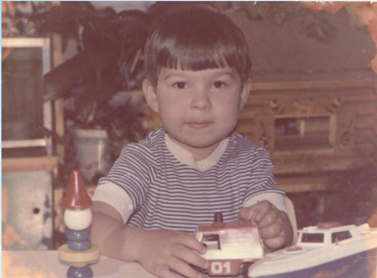
Мой папа пошел в детский сад в 1982 году