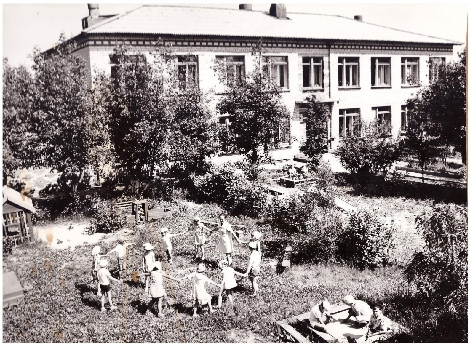
Баранниковский детский сад. Начало 70-х годов 20 века.