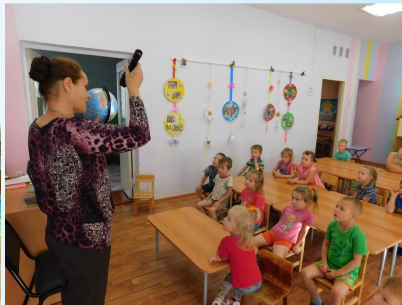
О книжке «Погода в картинках». Зареченский детский сад