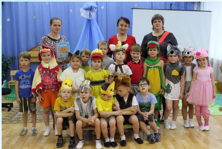
Праздник «Почитаем, поиграем!» по стихам С. Я. Маршака. Баранниковский детский сад